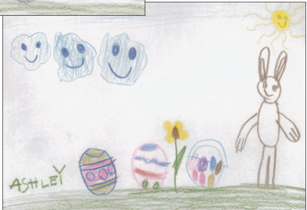
Ashley, 5 Jahre