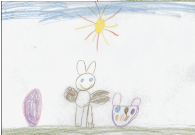
Leni, 5 Jahre